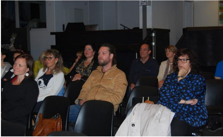
Socie e soci presenti in sala