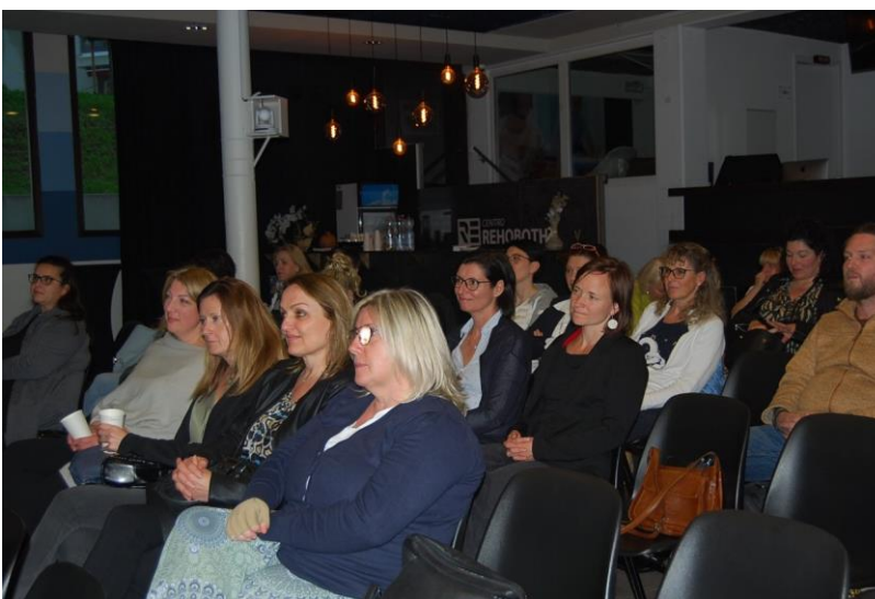
Socie e soci presenti in sala