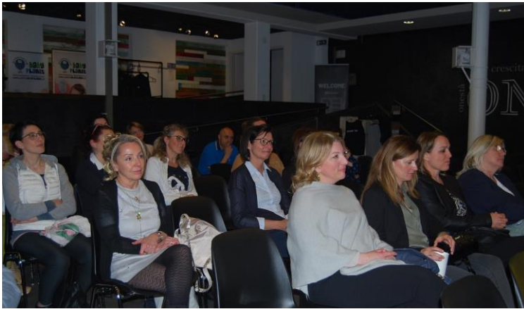
Socie e soci presenti in sala